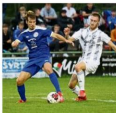
Ob für TuSpo Petershütte (blau) und den SV Rotenberg, hier im Pokalduell, die Saison weitergeht, ist offen.

Das hieße für die Mannschaften auf Bezirksebene, dass spätestens in der letzten Märzwoche der Trainingsbetrieb aufgenommen werden kann. Maßgeblich hierfür sind allerdings die niedersächsischen Sonderverordnungen im Zuge der Co-