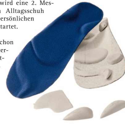
Bild: Unterstützung ist beispielsweise mit einer Joggingeinlage möglich.

Dabei werden schon die ersten Unterschiede sichtbar, welches Schuhwerk den Bewegungsablauf fördert und welches nicht.